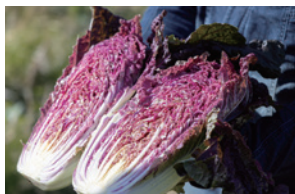
仙台市若林区・山田農園さんの新鮮野菜