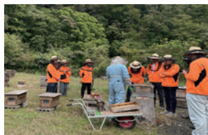
仙台市秋保・森と蜂とさんの蜂蜜