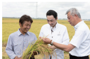
登米市・忠義さんのササニシキ